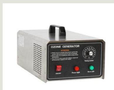
Generador portàtil d'ozó OM-OPTC TA 20

Tots els olors són eliminats, les partícules de la matèria són descompostes i reemplaçades amb oxigen puríssim.